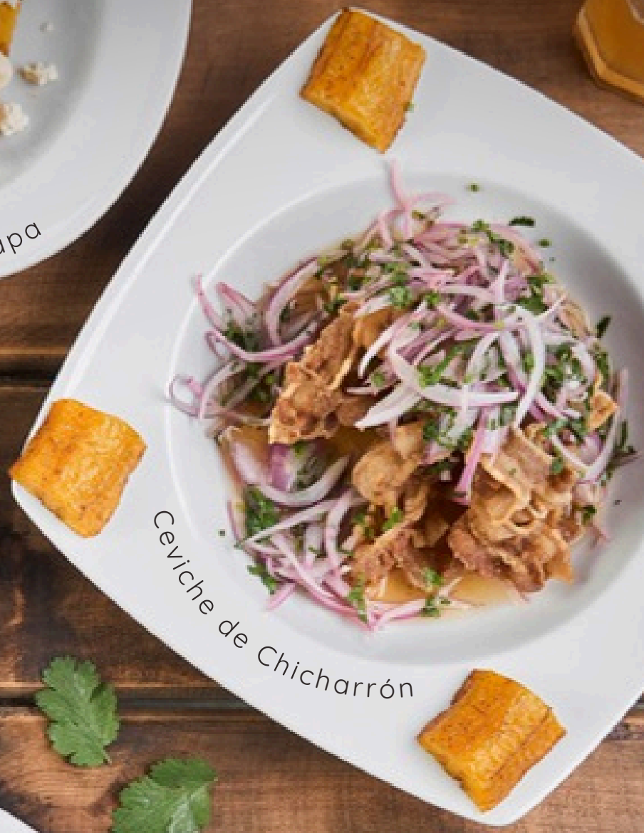
Ceviche de Chicharrón