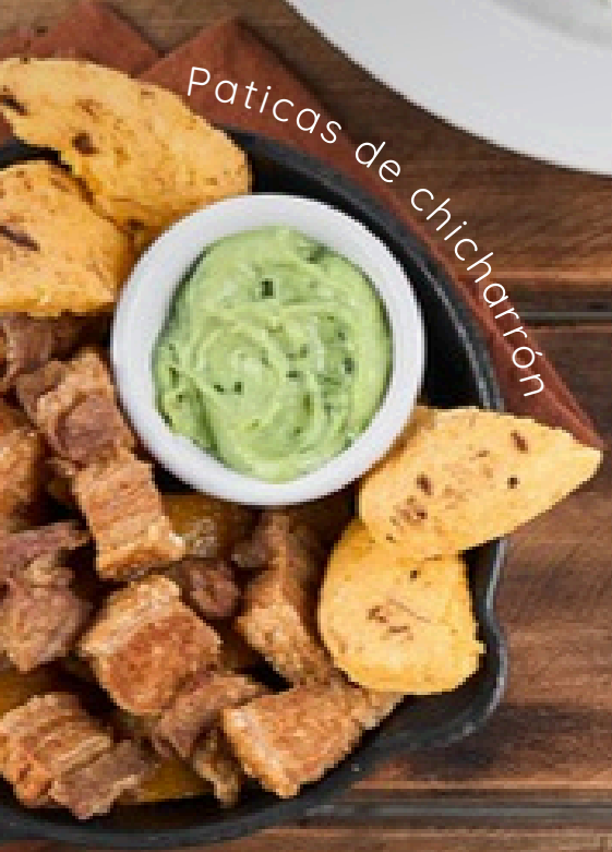
Paticas de chicharrón