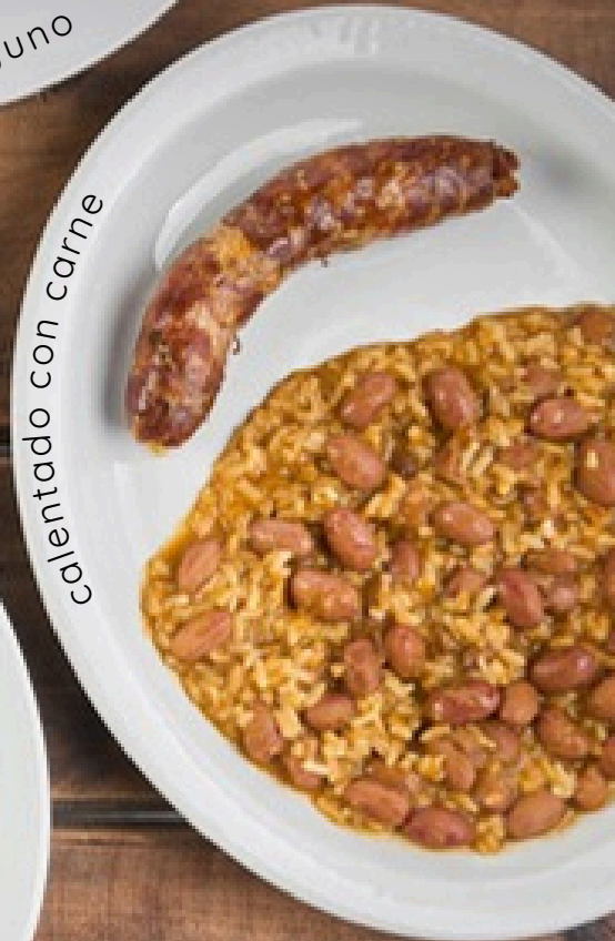
Calentado con carne