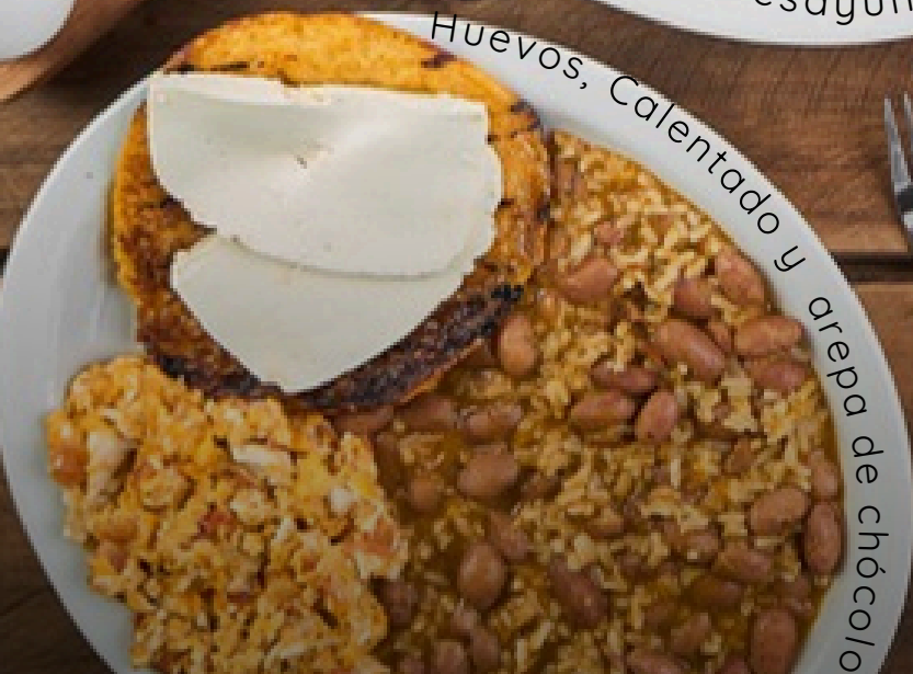
Huevos, Calentado y arepa de chόcolo