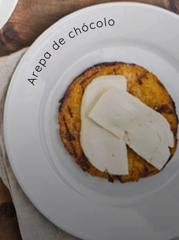
Arepa de chόcolo