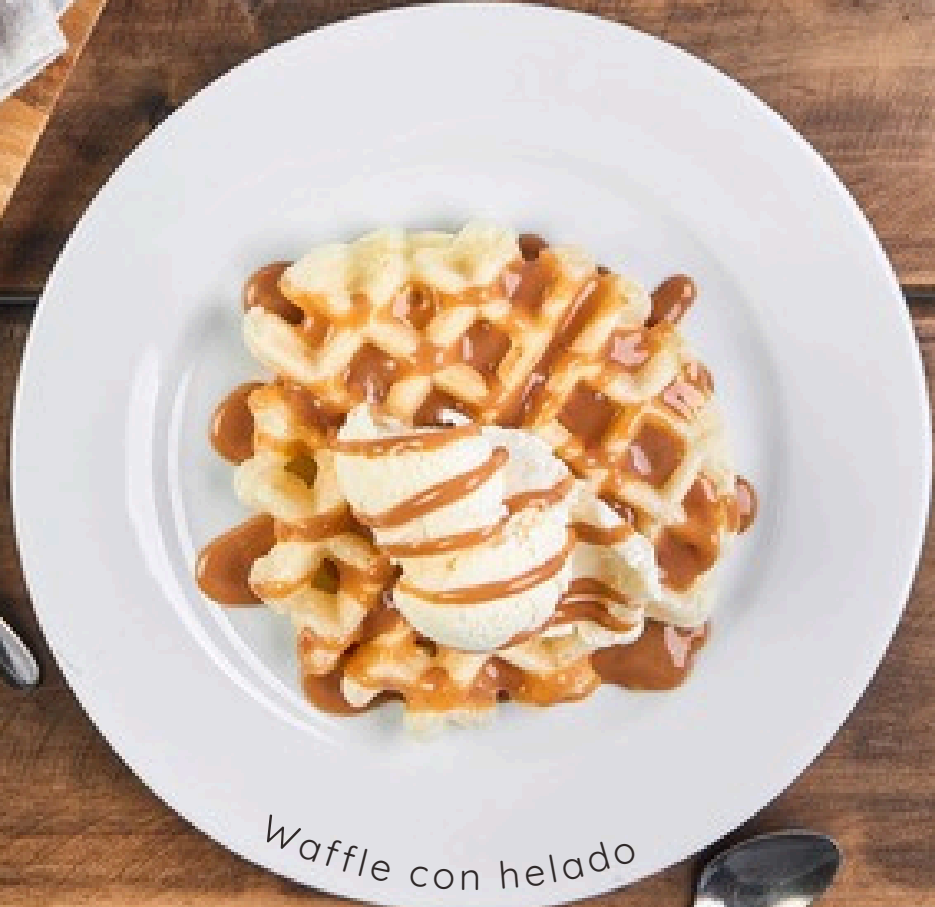
Waffle con helado