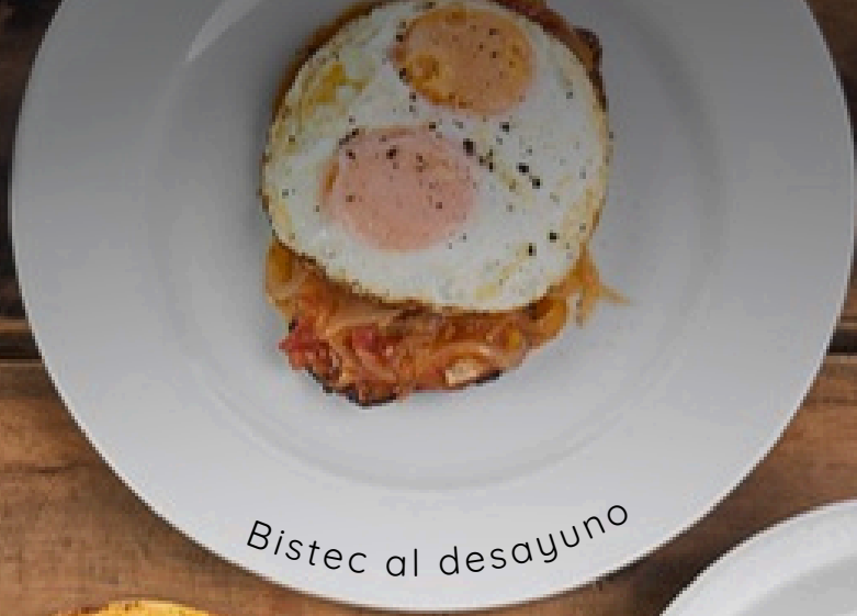
Bistec al desayuno