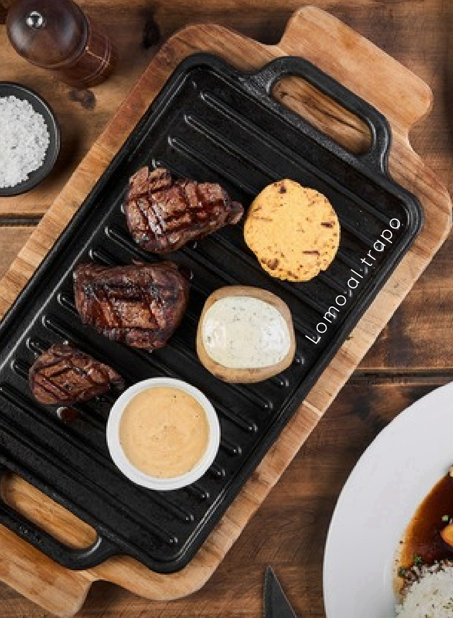
Lomo al trapo